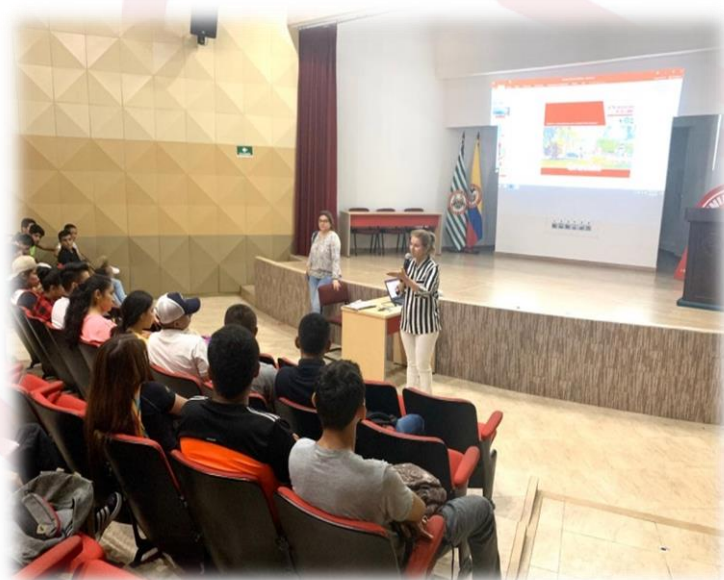
Registro Fotográfico 3. Consejería Grupal con Estudiantes de la FCHYE 2019