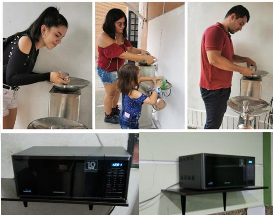
Registro Fotográfico 2: Boletín Interno N° 010 30/01/2020 y de la FCHYE

Esta meta se cumplió en un 100% lo proyectado para el año 2019. Con el propósito de mejorar las condiciones de bienestar a la comunidad académico-administrativa de la FCHyE, se adquirieron e instalaron dos (2) bebederos de agua con doble poceta y sistemas de filtración ultravioleta, los cuales se ubicaron: uno frente a la decanatura de la Facultad y el otro en la entrada del Coliseo de la sede Barcelona, donde funciona el Programa de Licenciatura en Educación Infantil. Así mismo, se adquirieron cinco (5) hornos microondas, de los cuales se han instalado tres (3) así: Uno (1) en el Programa Lic. Educación Física y Deportes, Uno (1) en Lic. Pedagogía Infantil y Uno (1) en la Oficina del Consejo Estudiantil.