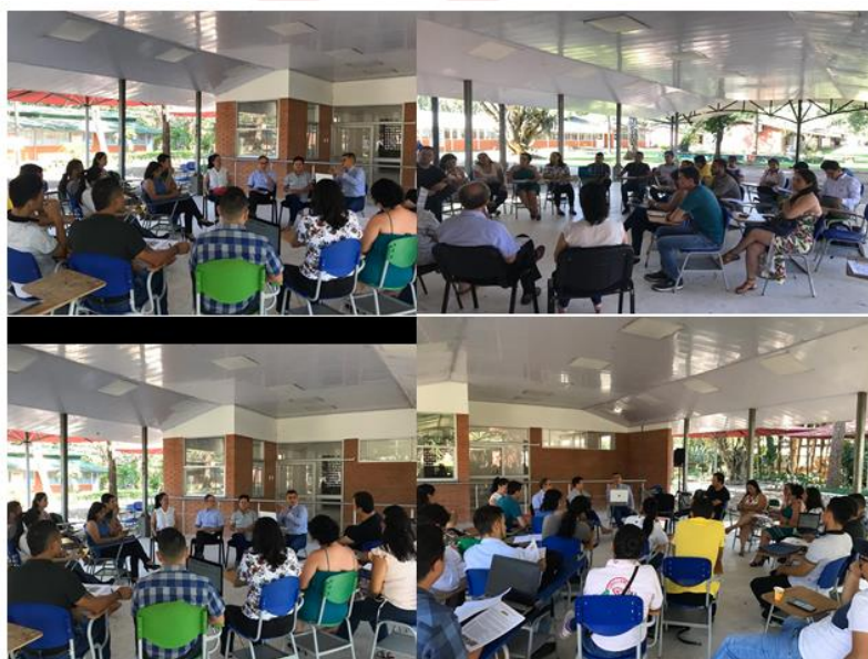
Registro fotográfico 1. Evento Socialización de Experiencias Significativas.