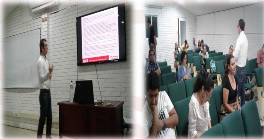
Registro Fotográfico 4. Jornada de Socialización Estructura Orgánica FCHYE 20/09/2019